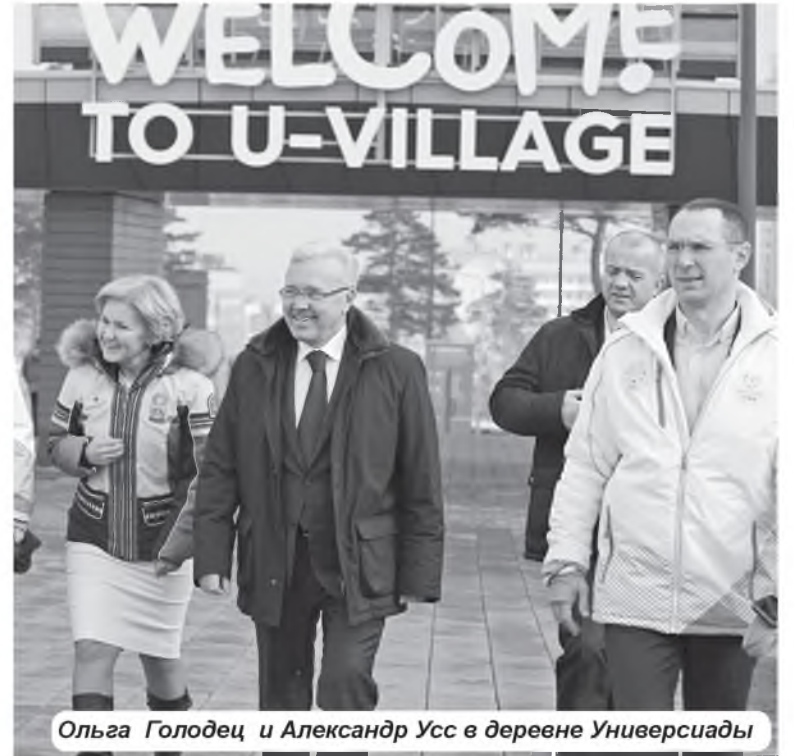
Ольга Голодец и Александр Усс в деревне Универсиады