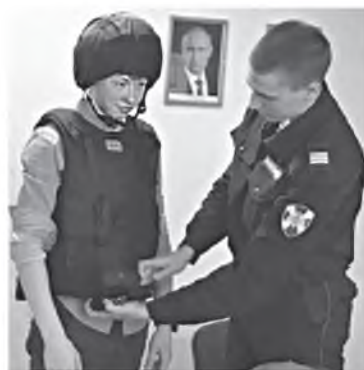
Школьники на экскурсии

В преддверии празднования дня образования Федеральной службы войск национальной гвардии Российской Федерации в отделении вневедомственной охраны по Иланскому району проводился «День открытых дверей».