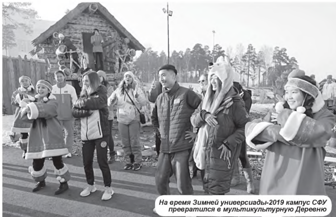
На время Зимней универсиады-2019 кампус СФУ превратился в мультикультурную Деревню