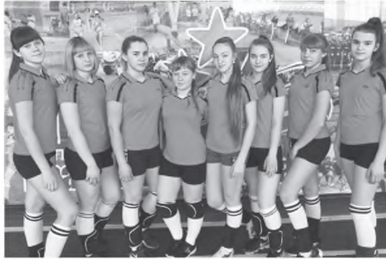
Команда школы №1

Прошли финальные краевые соревнования по волейболу среди девушек в рамках Школьной спортивной лиги.