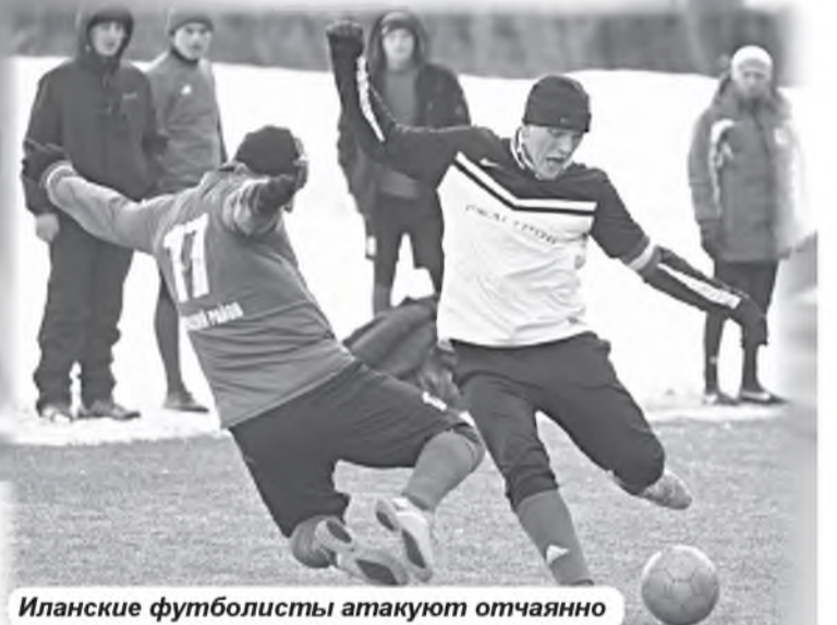
Иланские футболисты атакуют отчаянно