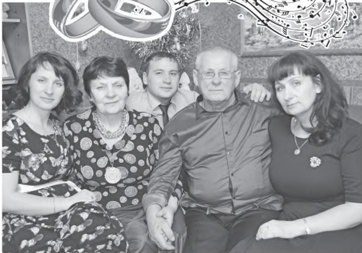
Родители и дети вместе

Вот такую удивительную историю ЛЮБВИ мы хотим вам сегодня рассказать.